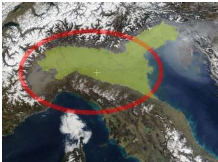
“Câmpia Padului”.

În Câmpia Padului (Pianura Padana) se găsesc aproape 23 de milioane de oameni (40% din totalul populației) și acoperă 50% din PIB-ul național. Reprezintă zona cea mai industrializată a Italiei, cu terenurile alocate agriculturii în continuă scădere: 28% din terenurile agricole au fost folosite pentru clădiri și industrii încă din anii 1970. Această pierdere de sol agricol accentuează dificultățile legate de pierderea biodiversității din cauza agriculturii intense și chimice în suprafața agricolă rămasă.