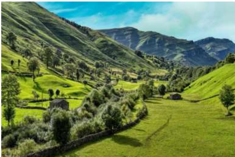
“Valles Pasiegos”, una din regiunile rurale ale regiunii Cantabria.

Cu toate acestea, există multe organizații de tineret din mediul rural care se străduiesc să stimuleze participarea tinerilor în comunitățile lor. Se confruntă totuși cu dificultăți tot mai mari în a-și menține acest angajament pe termen lung. Un motiv comun este reprezentat de lipsa instrumentelor și mijloacelor adaptate așteptărilor și dificultăților lor. Dar cunoașterea insuficientă a resurselor relevante moștenirii locale este un alt motiv care face dificilă implicarea tinerilor în viața locală. În același timp, grupurile de conservare a patrimoniului rural se luptă să mobilizeze tinerii.