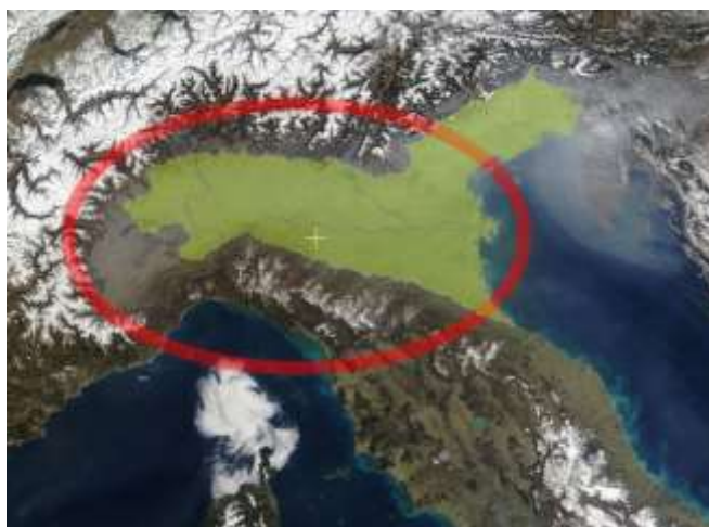
Llanura Padana.

El valle del Po es la zona más contaminada del país y una de las más contaminadas de Europa. La contaminación proviene no solo de las actividades agrícolas (especialmente la ganadería intensiva) sino también de las industrias y fábricas. Más aún, la disposición geográfica de las montañas no ayuda a que el aire circule. Los únicos vientos provienen del este y están encerrados en las cadenas montañosas circundantes, lo que convierte a Turín en una de las ciudades más contaminadas de la zona. El CO 2 y otros agentes contaminantes, como consecuencia, quedan capturados en la atmósfera.