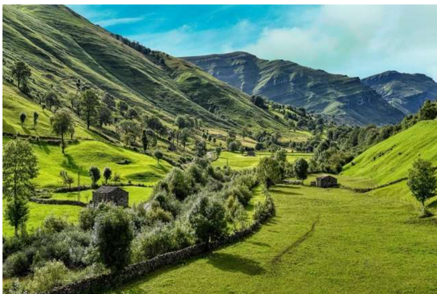
“Valles Pasiegos”, una de las regiones rurales de Cantabria.

Sin embargo, hay muchas organizaciones juveniles rurales que se esfuerzan por impulsar la participación de los jóvenes en sus comunidades, pero se enfrentan a dificultades cada vez mayores para conseguir este compromiso a largo plazo. La falta de herramientas y medios adaptados a sus expectativas y dificultades es una razón común, pero también hay un conocimiento insuficiente de los recursos que encarna el patrimonio local para atraer a los jóvenes a involucrarse en la vida local. Al mismo tiempo, los grupos de conservación del patrimonio rural luchan por movilizar a los jóvenes.